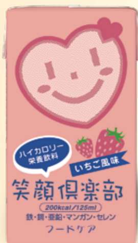
さわやかな いちご風味