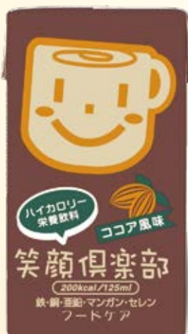
ぬくもりの ココア風味