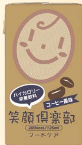
コクと香りの コーヒー風味