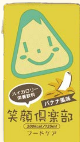
ほのかな甘みの バナナ風味