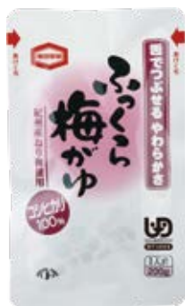
ふっくら梅がゆ 200g 紀州産ねり梅を使用した 自然でやさしい味付けです。