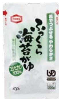
ふっくら海苔がゆ 200g 磯の香り豊かな海苔の 佃煮を使用しました。