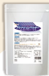
アクアジュレパウダー