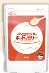
ホットでもゼリー