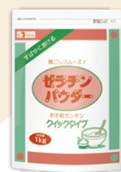
ゼラチンパウダー クイックタイプ