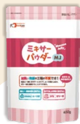
ミキサーパウダーMJ